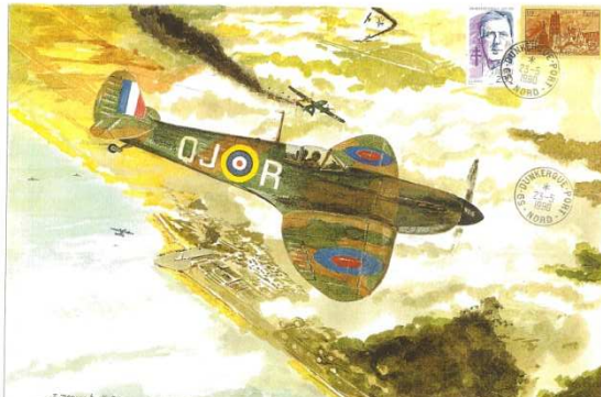
VICTOIRE AU DESSUS DE DUNKERQUE. Le 23 Mai 1940 Bob Stanford-Tuck aux commandes d'un Spitfire du Squadron N°52 vient d'abattre un He110, ce sera ce jour là sa troisième victoire; un He109 le matin puis plus tard deux He110...

Les 'CIGOGNES' du NIEUPORT au MIRAGE 2000